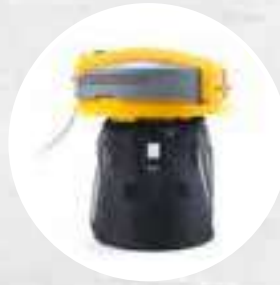
FILTRE DE PROTECTION EN NYLON