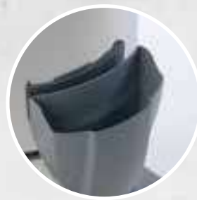
BOUCHE DE CHARGEMENT DU RÉSERVOIR

Les nouveaux modèles de lave-moquettes tiennent compte des besoins quotidiens de tous les opérateurs, également par leur facilité d'utilisation. Les chariots à poignée (sur les plus grands modèles) facilitent les mouvements et le déplacement de la machine sur tout type de surface. Le système de développement vertical à travers deux fûts en acier (solution détergente et de récupération) ajoute non seulement du professionnalisme à l'ensemble de la gamme mais la rend aussi très utile au quotidien. Les opérations de chargement et de déchargement sont extrêmement facilitées; elles peuvent s'effectuer presque simultanément. Grande bouche de chargement résistante: remplir le réservoir de solution détergente n'a jamais été aussi facile. Pratique, l'indicateur de niveau signale quand s'arrêter. Tuyau d'évacuation pour faciliter le vidage du réservoir. Sécurité accrue sur les modèles Power Extra 11, 21, 31, grâce au pressostat de série et au filtre de protection.