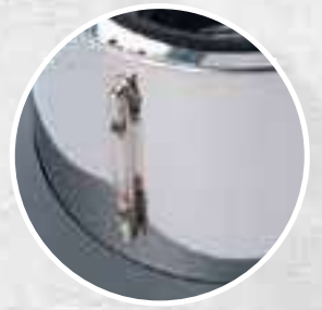
INDICATEUR DE NIVEAU SOLUTION NETTOYANTE