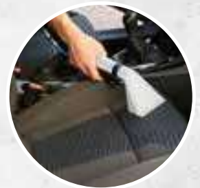
COMMODITÉ ET FACILITÉ D'UTILISATION